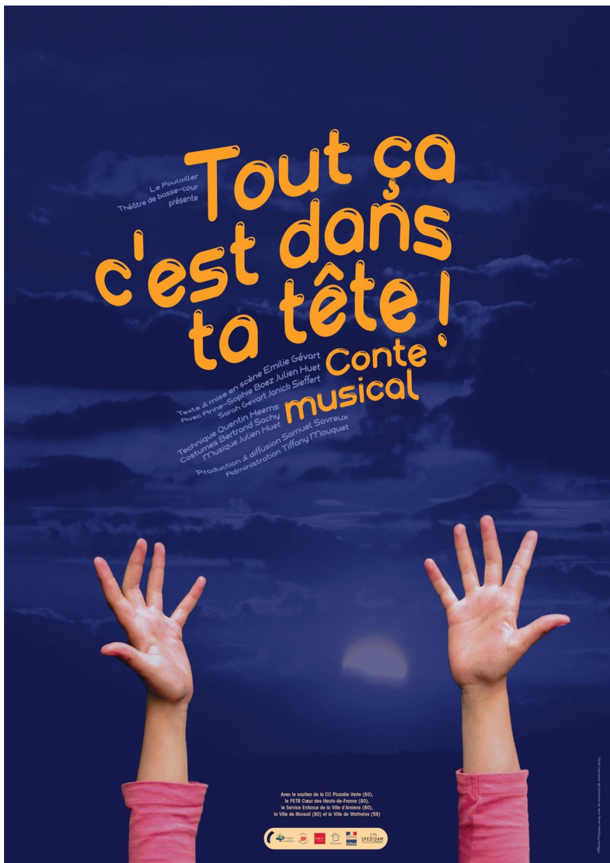
Affiche / Crédit Philippe Leroy